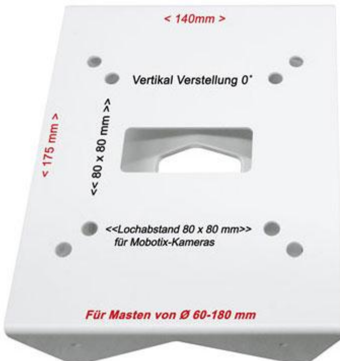
Mobotix original Masthalter

Der „Clevere“ Masthalter nicht so wuchtig wie das original. NEU mit Horizontal- und vertikalem- Neigewinkel bis 22° stufenlos verstellbar. Schluss mit einseitig hängendem Horizont. Schluss mit unterlegen des Masthalters, einfach stufenlos verstellen.